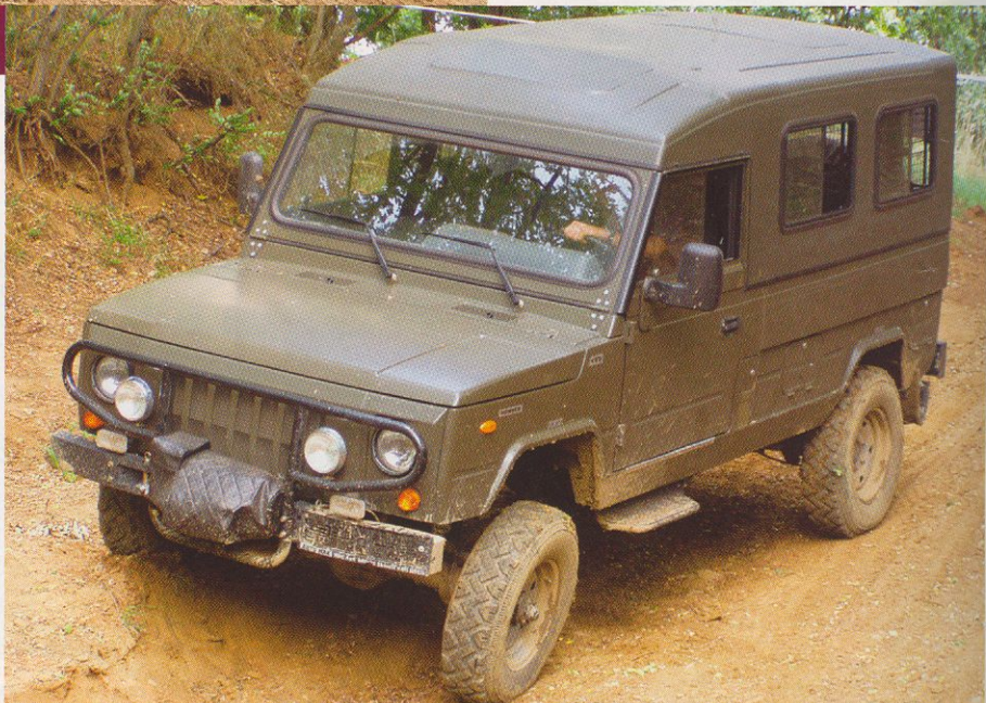
Novinkou rozšiřující nabídku pracovních off-roadů na našem trhu je polský Honker

K dispozici byla vozidla ARO všech tří řad: 24, 32 i 33. Vedle motorů Andoria 2.5 TD dostává v tuzemsku ARO i spojku Valeo a převodovku Eaton – TCZEW. Jen v základním prospektu importéra jsme napočítali čtyři verze řady 24 (rozvor 2350 mm), pět verzí řady 32 (rozvor 3200 mm) včetně maxi provedení pro 10 osob a šest různých nástaveb na šasi řasy 33 (rozvor 3340 mm). Je to úctyhodná nabídka, a přitom základní model ARO 240 klasik pro 2 + 6 osob s plátěnou střešou pořídíte již za 369 000 Kč. Jak se zájemci mohli přímo