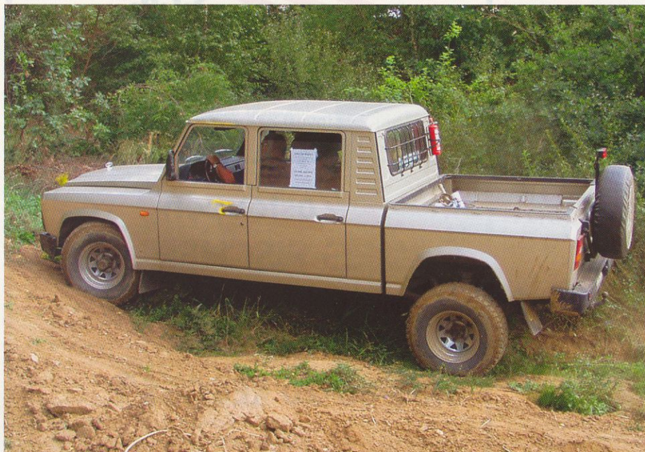
Pick-up řady 320 nabízí pětimístnou dvoubudku a ještě rozměrný nákladový prostor

robce připravuje ještě v letošním roce představení nového motoru s přímým vysokotlakým systémem vstřikování Common-Rail. Nový motor by měl mít označení A 110 Di a bude již splňovat připravovanou emisní normu Euro 4. Maximální výkon motoru bude 85 kW a největší točivý moment 265 Nm.