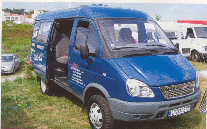
Značka GAZ se o návrat na náš trh pokouší s lehkým užitkovým automobilem GAZelle, dodávaným i v provedení 4x4