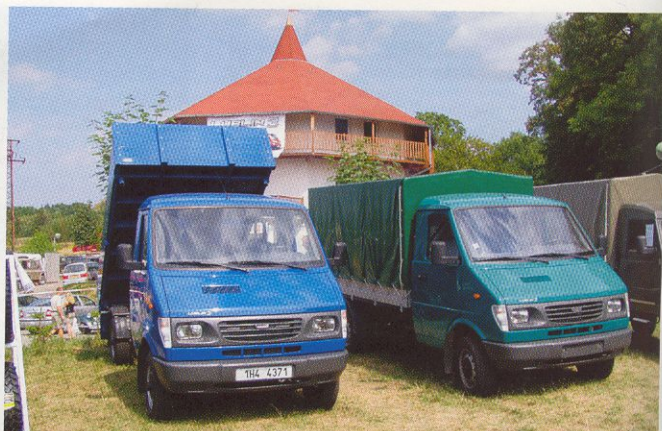
Polský Lublin 3 je dodáván ve dvou hmotnostních verzích v mnoha karosářských variantách, vždy ale s motorem Andoria 2.5 TD

nikovou nástavbou. Velkou pozornost budila také montážní verze s dvoubudkou pro pět osob, doplněná o valníkovou nástavbu. Třetí generace lehkého užitkového nákladního automobilu Lublin je vyráběna ve dvou délkách rozvorů a zájemce si může vybrat mezi vozidly s celkovou hmotností 2,9 tuny resp. 3,5 tuny. Má homologaci N1 a měly by zájemce zaujmout nejen příznivou pořizovací cenou, ale také nízkými provozními náklady, nízkou cenou náhradních dílů i velmi rozumnou cenou práce v servisu.