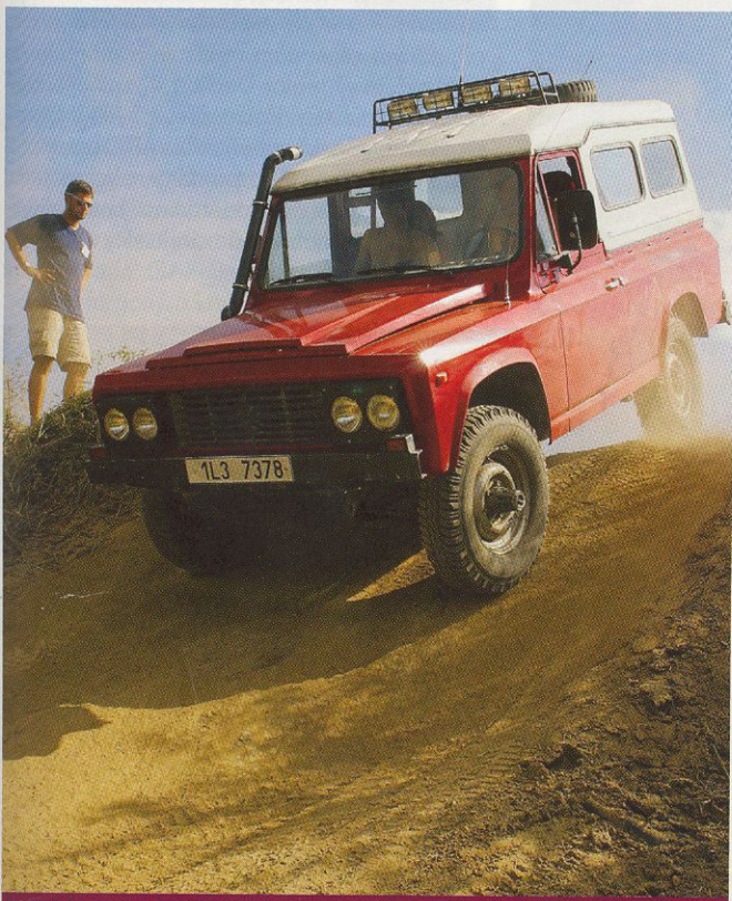
Základní provedení modelu ARO s pevnou střechou patří na našich cestách k nejrozšířenějším verzím

Druhé klubové a prezentační setkání příznivců terénních a pracovních vozů ARO, UAZ, Honker, a Lublin se konalo nedávno v Benešově u Prahy.